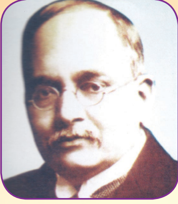
नामदार गोपाळ कृष्ण गोखले